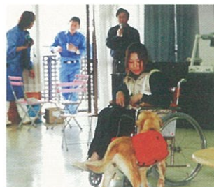
介助犬の啓蒙活動

肢体不自由により日常生活に著しい支障がある身体障害者のために物を拾い上げ及び運搬、着脱衣の補助、起立の際の支持、扉の開閉、スイッチの操作等、肢体不自由を補う介助を行う犬のことで