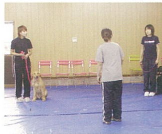
動物愛護センター職員の方々と しつけ方教室

日本全国で、年間30万頭もの犬が保健所で殺処分されています。その数を一匹でも減らそうと…、一匹でも多くの捨て犬が新しい家族の元に迎えられるようにと、様々な研究に取り組んでいます。このことを「新しい家族の元に帰る」という意味で「リフォーミング」と呼んでいます。