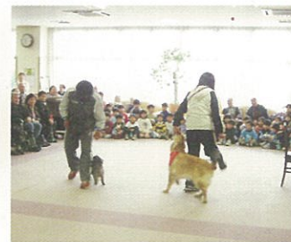
ドッグダンスチームによる慰問活動