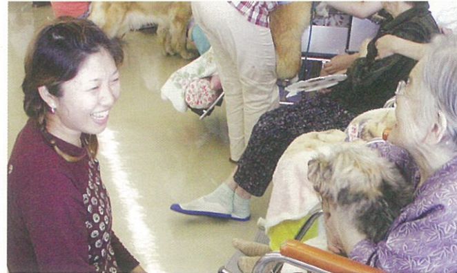
老人保健施設への慰問活動