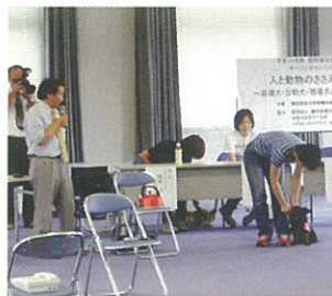
聴導犬の啓蒙活動

聴覚障害による日常生活に著しい支障がある身体障害者のために、目覚ましの音、インターホンの音、電話・ファックスの呼び出し音、その人を呼ぶ声等を聞き分け、その人に必要な情報を伝え音源への誘導を行う犬のことで