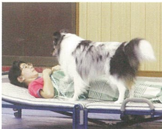
目覚まし音を知らせている様子