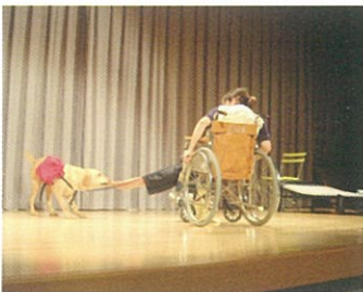
着脱衣の補助をしている様子