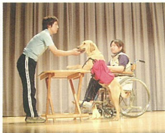
財布をレジの人に渡している様子