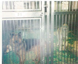
保健所に収容された犬たち