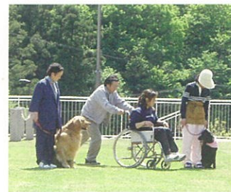
セラピー犬適正検査

動物を撫でていると血圧が下がる、精神的安定や自尊心をもたらすなどいろいろな効果結果が、この活動により報告されています。動物は無償の愛情と遊び心を持っています。人間にはない温もりがときには堅く閉ざされた人の心を開くこともあるのです。