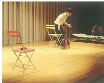
音源への誘導をしている様子